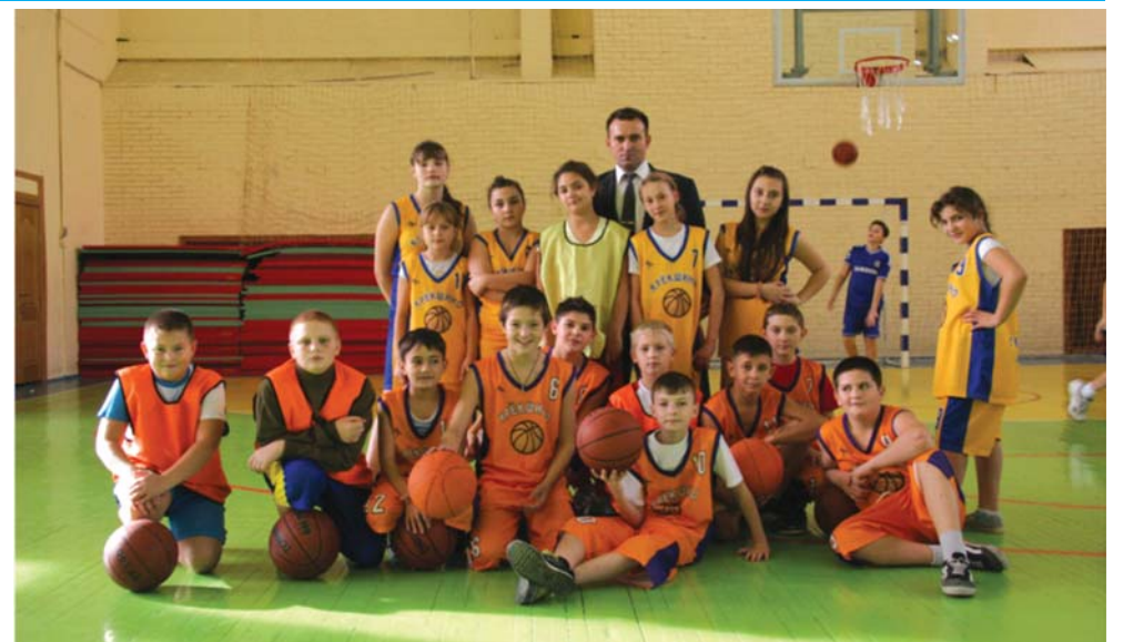
Сборная школы №2059 (ШО-2) занявшая II место на V традиционном турнире по баскетболу в г.Троицк 19.10.2014 г. среди команд ТиНАО и МО.